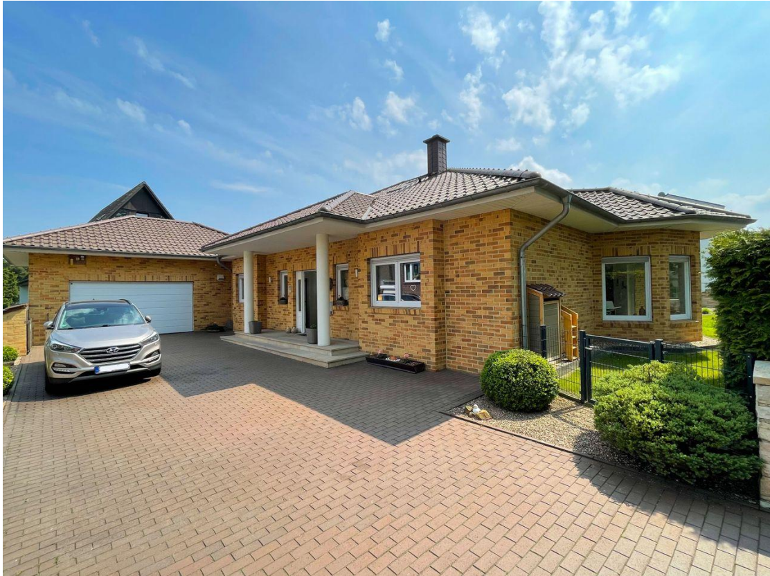
Hausansicht StraÙe 5