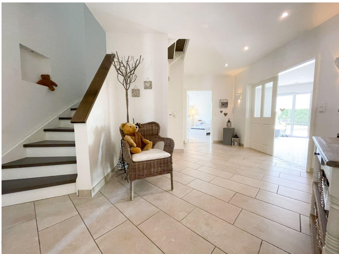
Eingang Flur 2