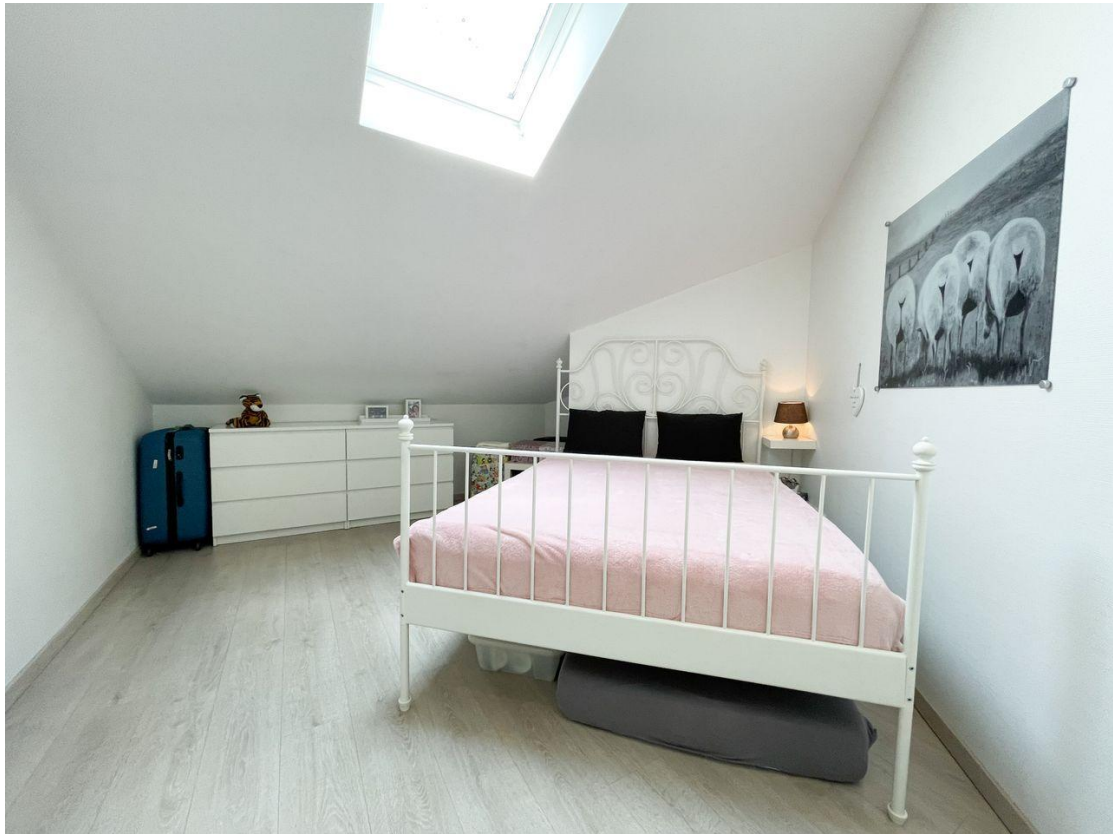
Gäste Zimmer OG