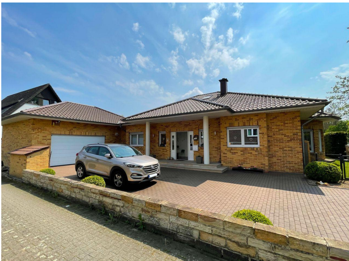
Hausansicht StraÙe 3