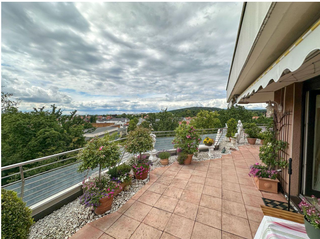
Blick Terrasse 2