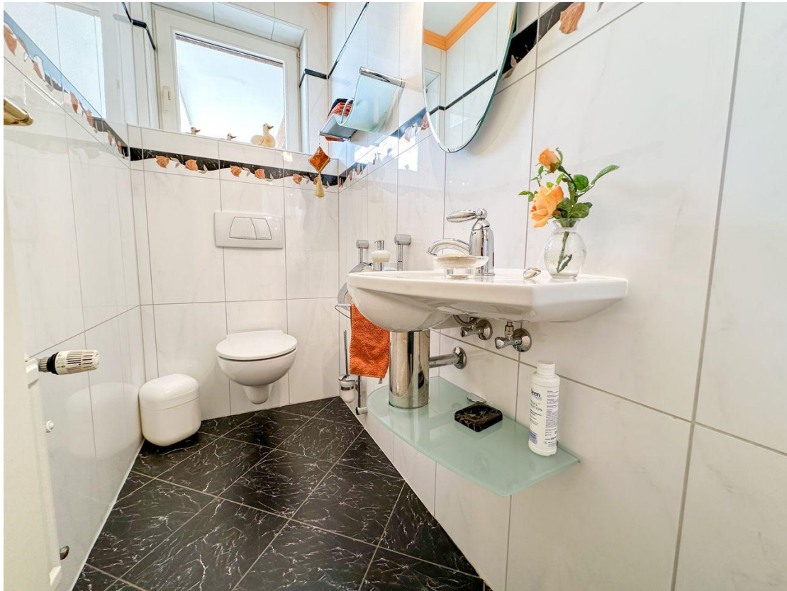
Gäste WC 2