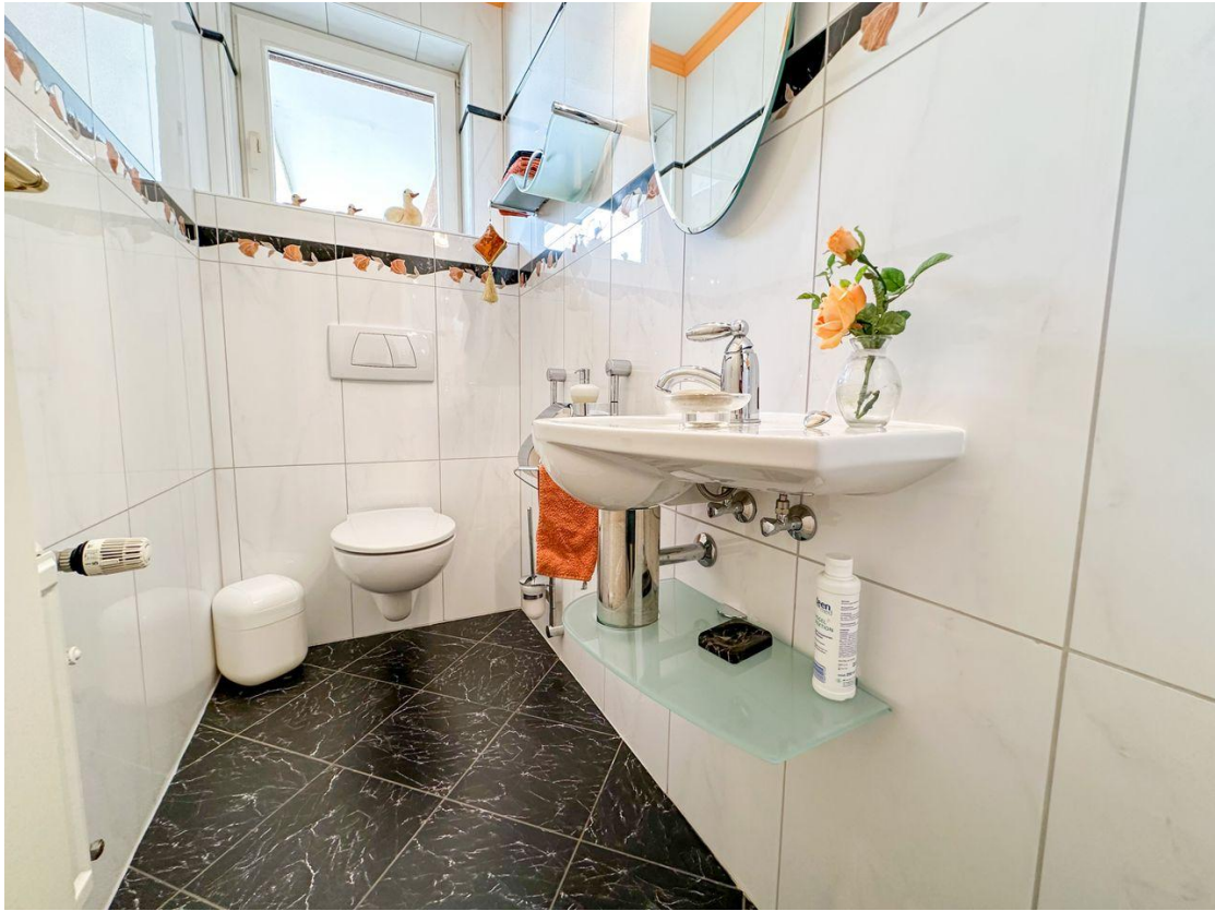
Gäste WC 2