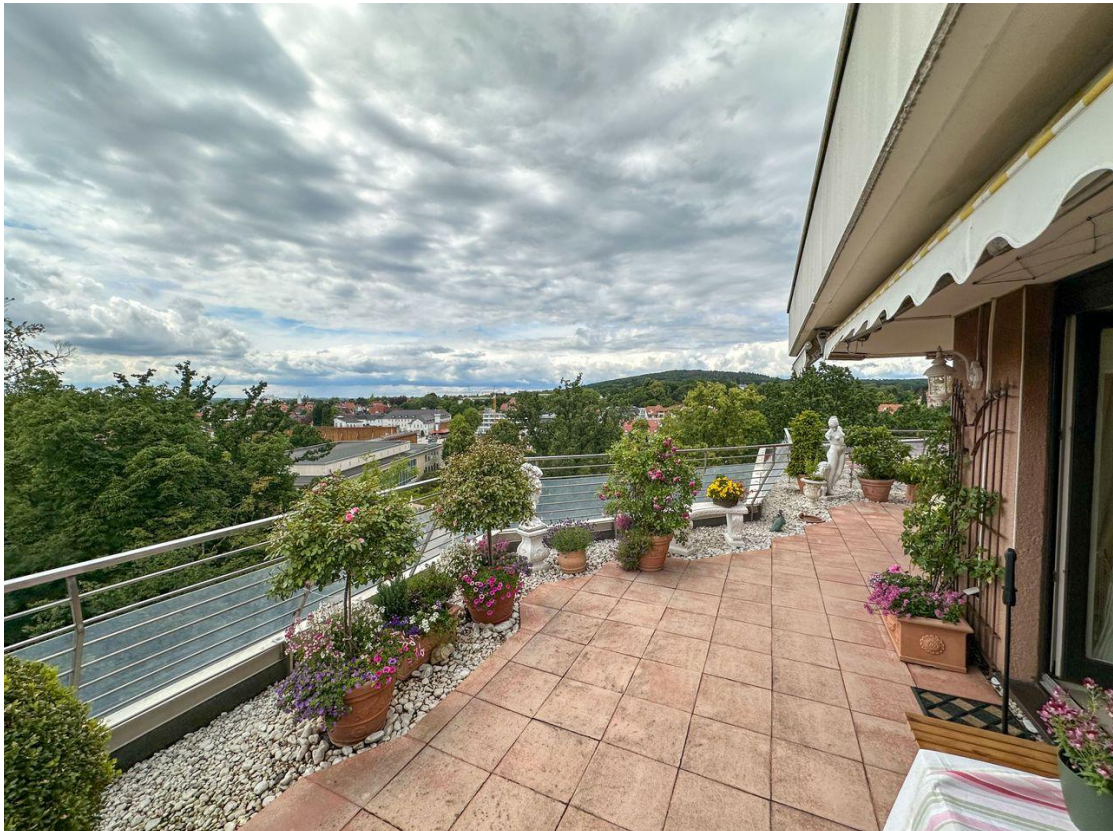
Blick Terrasse 2