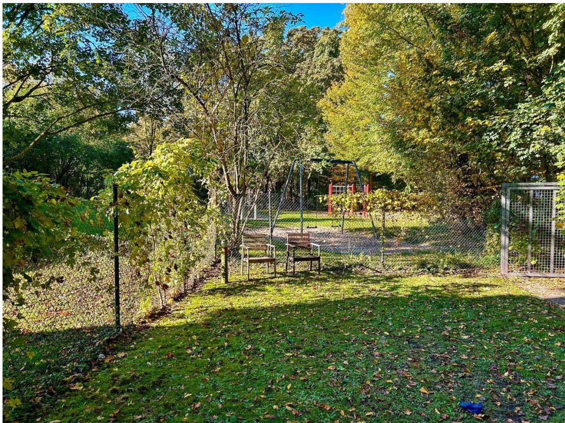
Spielplatz am Haus