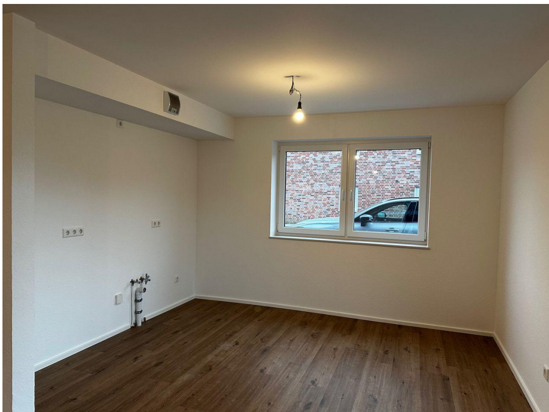
Küchenbereich im Whz