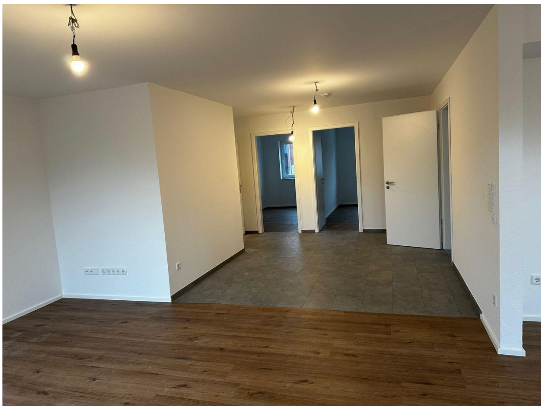
Blick vom Whz in Diele