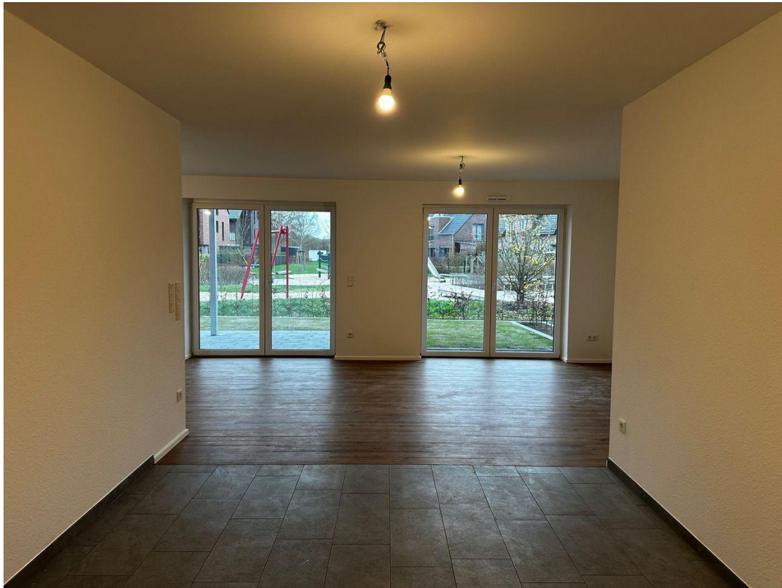
Blick von Diele in Whz