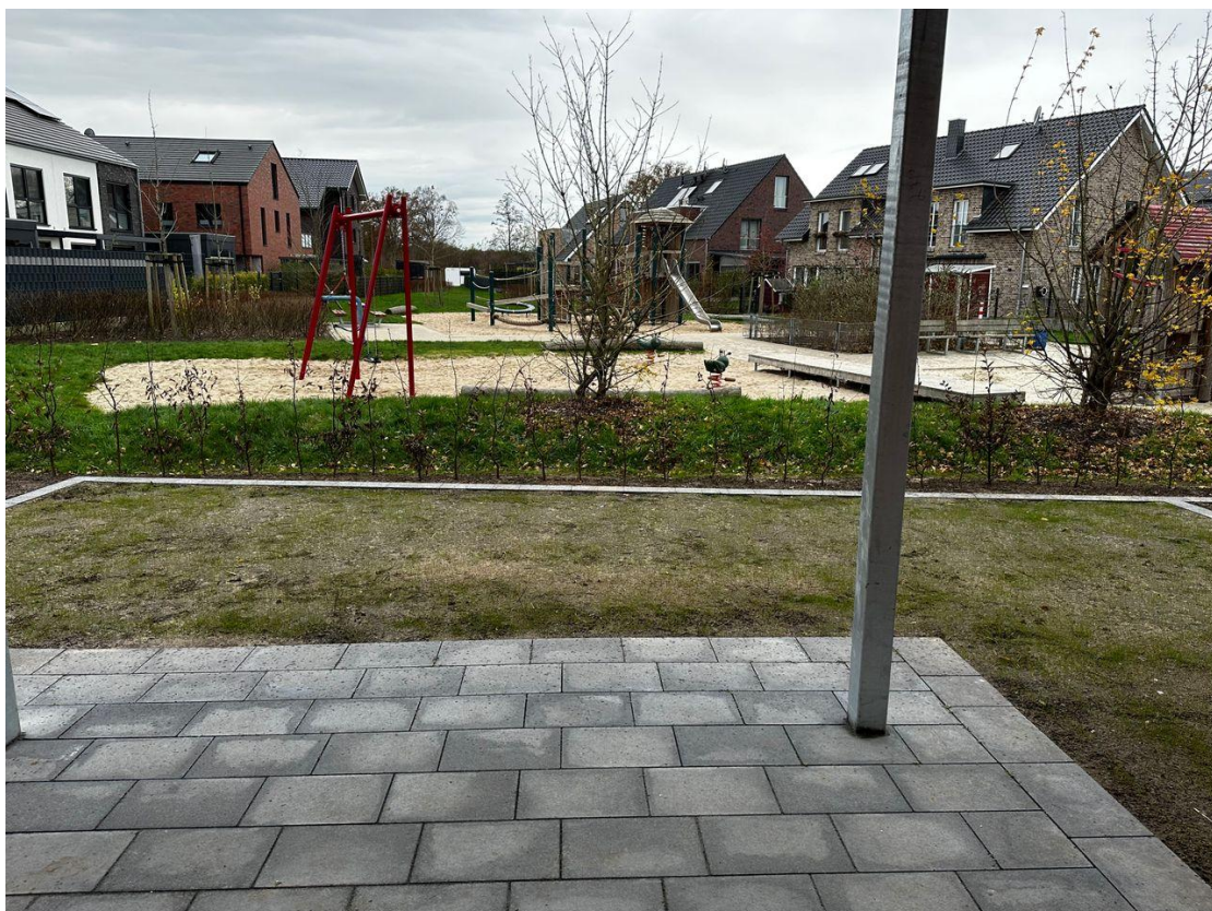
Blick von Terrasse