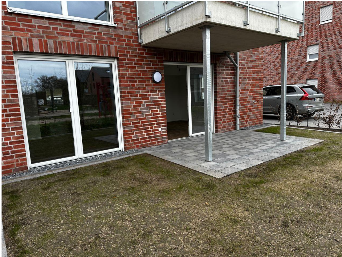
Terrasse, Garten 1.1